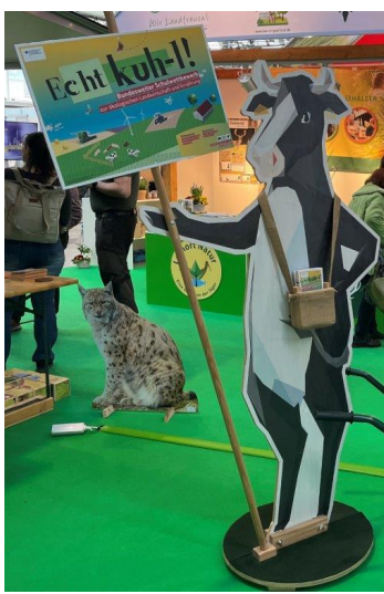
Die kuh-le Kuh auf Tour